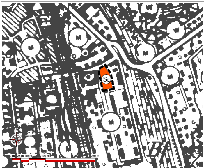
Abb.: Auszug aus dem wirksamen Flächennutzungsplan der Stadt Dillenburg

Entsprechend den Vorgaben des § 13a (2) Nr. 2 BauGB wird die Stadt den Flächennutzungsplan im Wege der Berichtigung anpassen. Die Durchführung eines formellen Verfahrens ist hierzu nicht notwendig.