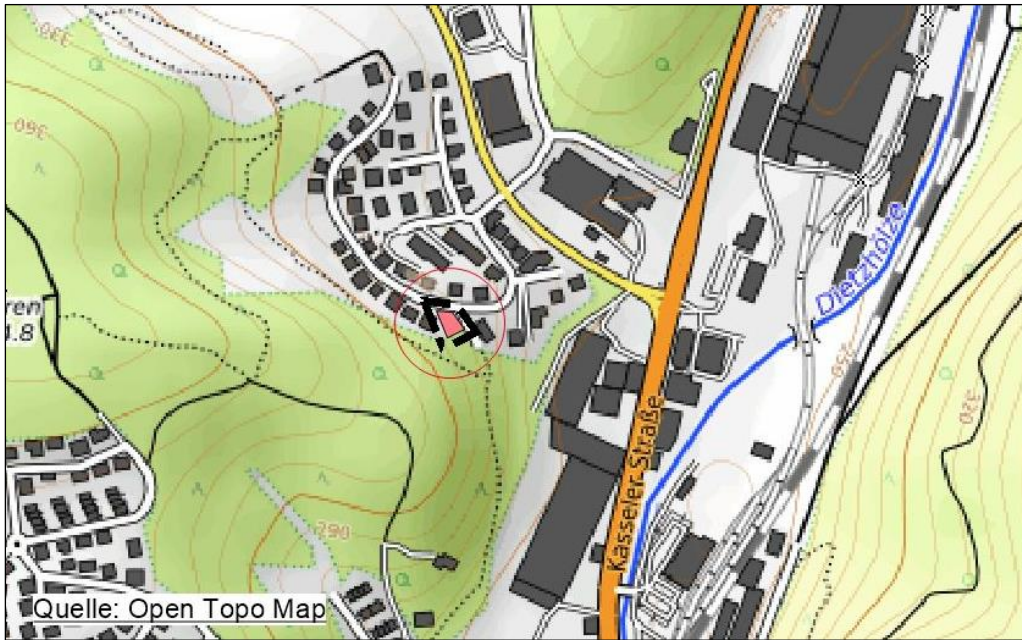
Lage des Plangebietes