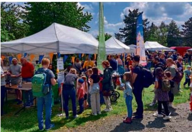
Auf dem Platz vor der Freilichtbühne am Dillenburg Schlossberg haben in den vergangenen Jahren viele Gruppen und Vereine ihre Stände aufgebaut und Aktionen durchgeführt.

Vereine und Jugendgruppen, die sich aktiv an den Jugendsammelwochen in diesem Jahr beteiligen möchten, können sich die notwendigen Unterlagen am Mittwoch, den 4. März, im Rathaus der Oranienstadt Dillenburg in der Rathausstraße 7, Zimmer 30 ab 18 Uhr abholen. Für Fragen und Auskünfte steht Frau Friedrich unter der Telefonnummer 02771/896-150 gerne zur Verfügung. Magistrat der Oranienstadt Dillenburg