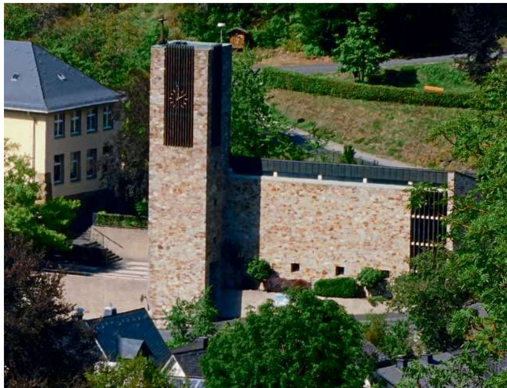
Evangelische Kirche in Nanzenbach.

Christliche Gemeinde (Erlenstraße 8-10) Sonntags: 10 Uhr Mahlfeier/