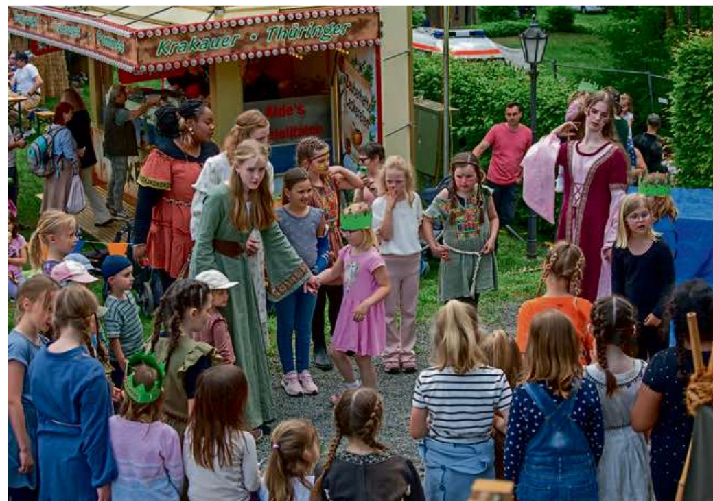
Schulen, Vereine und Gruppen sind eingeladen, sich mit märchenhaft gestalteten Ständen oder kostümierten Akteuren zu beteiligen.

und 25. Mai) stehen zudem mehrere Aufführungen des Musicals „Schneewittchen und die sieben Zwerge – Das HILF-Treibende Musical“ von Christian Berg und Katja Tiltmann auf dem Programm.