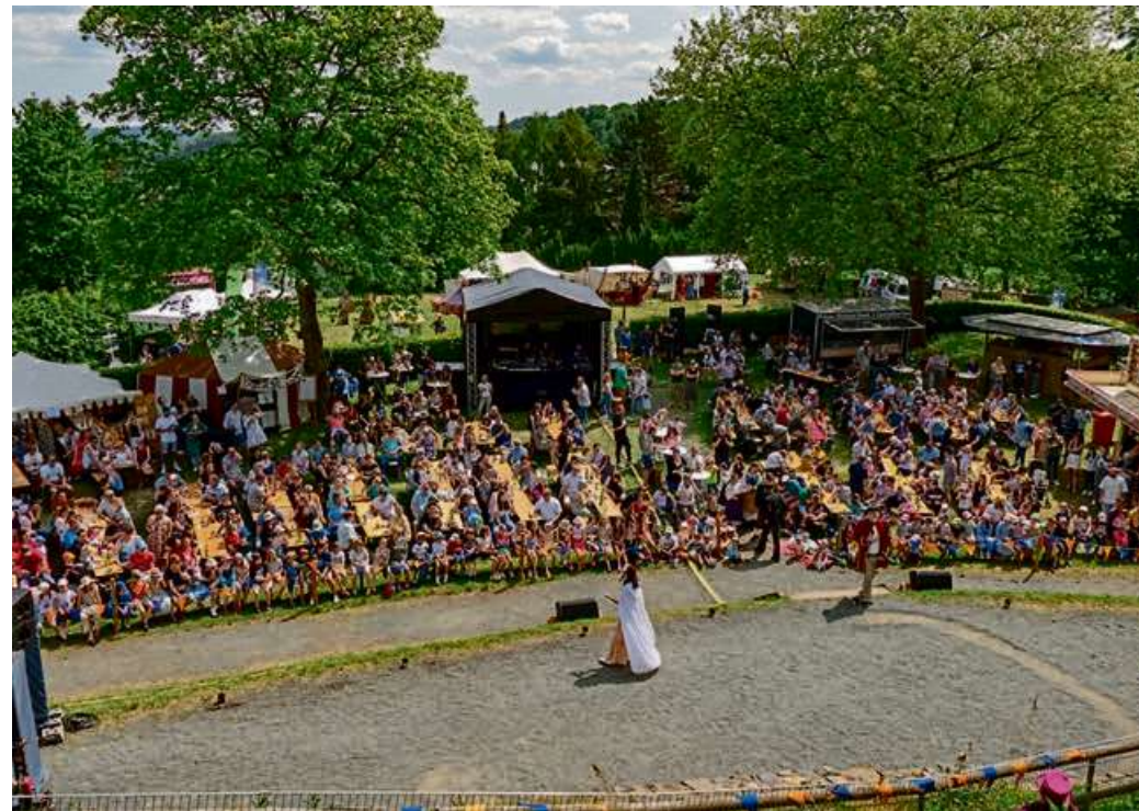
Auch in diesem Jahr lädt das Fähnlein zu Dillenburg zum Märchenfest auf den Schlossberg ein.

Neben den zahlreichen Mitmach- und Erlebnisangeboten auf dem Gelände dürfen sich Besucher auf besondere Programmpunkte freuen: Noch einmal unter dem Motto „Flaming Disco“ präsentiert das Fähnlein zu Dillenburg am Samstag- und Sonntagabend seine fulminante Feuershow „Funkenflug und Schattenklang“. Am Sonntag und Montag (24.