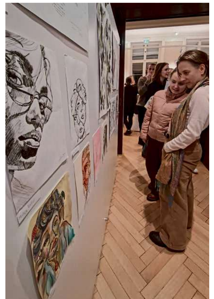
Großes Interesse an der Vielfalt der ausgestellten Werke: Besucherinnen betrachten die facettenreichen Porträts der aktuellen Ausstellung.