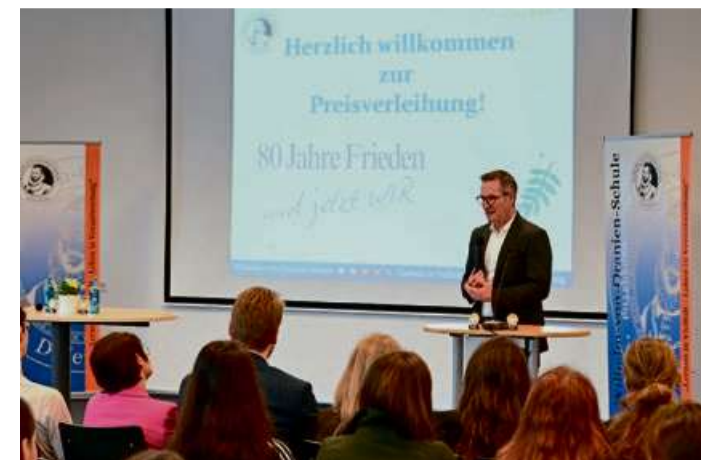
Der Landrat des Lahn-Dill-Kreises als Schulträger lobte die Schülerinnen und Schüler sowie das Organisationsteam des Wettbewerbs für das starke Signal der Wertevermittlung.