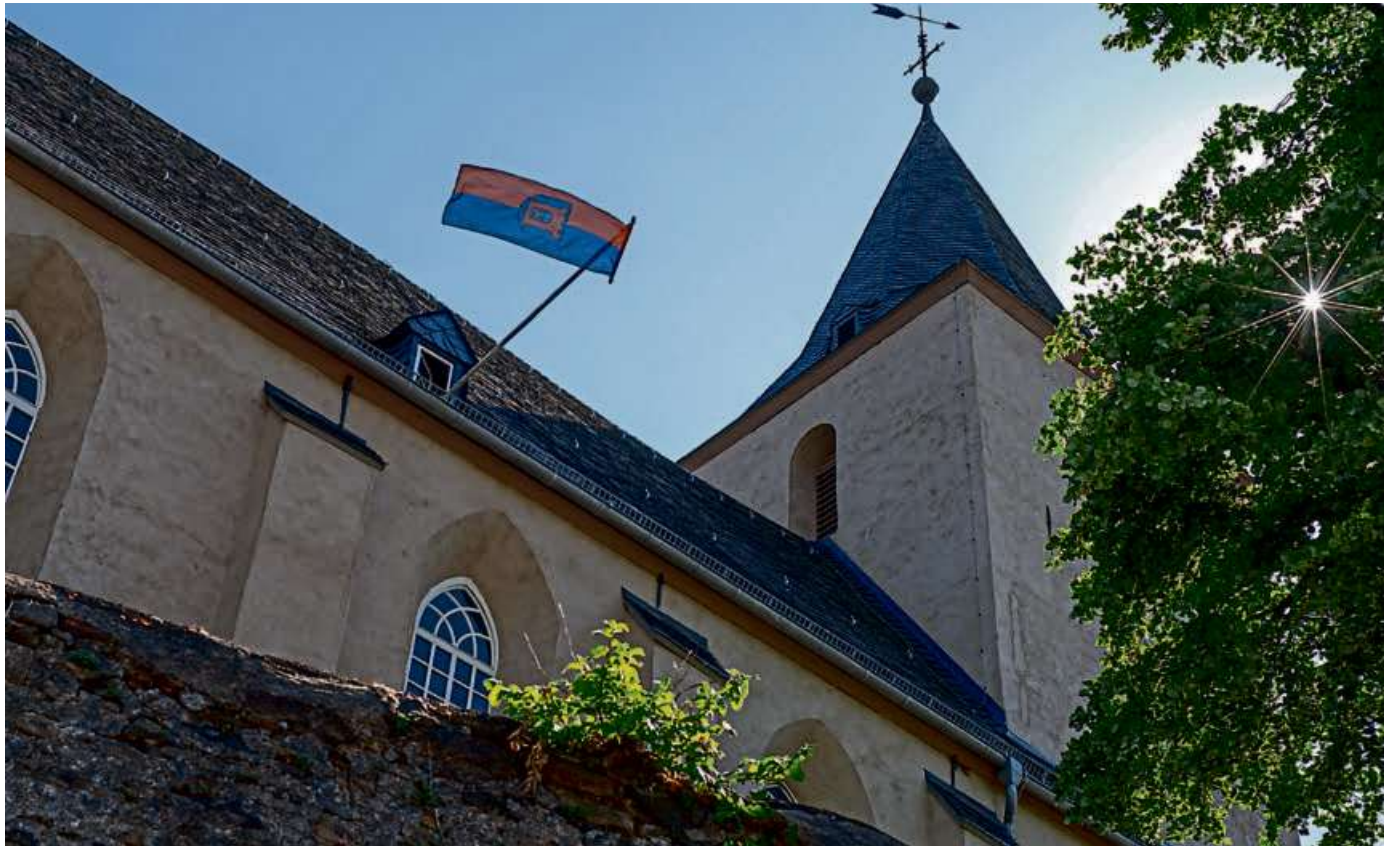
Die evangelische Stadtkirche in Dillenburg.