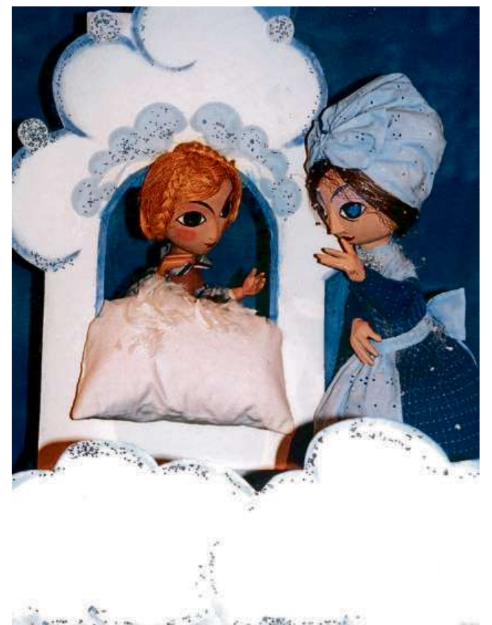
Die wunderbare „Frau Holle“ ist am Samstag, den 28. März im Rahmen der 7. Dillenburg Figuren Theater Tage zu bestaunen.

Eintrittskarten sind ab dem 9. März 2026 im Vorverkauf in der Tourist-Information in den Räumlichkeiten des Alten Rathauses (Hauptstraße 19) in Dillenburg erhältlich. Der Eintritt beträgt sieben Euro p.P. für die Familien-Vorführungen am Nachmittag. Für Kurzentschlos-