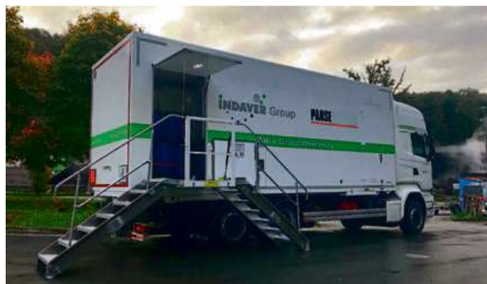
Im Lahn-Dill-Kreis ist das Unternehmen Panse aus Wetzlar mit der Einsammlung schadstoffhaltiger Abfälle beauftragt.

Außerdem werden im Lahn-Dill-Kreis jede Woche feste Schadstofftermine angeboten: Im Abfallwirtschaftszentrum Aßlar am ersten Samstag (8 - 12 Uhr) und zweiten Mittwoch (12 - 16 Uhr) des Monats, am Stadionparkplatz in Dillenburg am dritten Samstag (9 - 12 Uhr) und vierten Mittwoch (14 - 18 Uhr) des Monats. Insgesamt rückt das Schadstoffmobil somit zu jährlich 112 Sammelterminen aus.