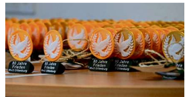
„80 Jahre Frieden – und jetzt wir?“ Die Teilnehmerpreise mit der Friedenstaube als Emblem erhielten alle, die mitgemacht hatten beim Schulwettbewerb der Wilhelm-von-Oranien-Schule.