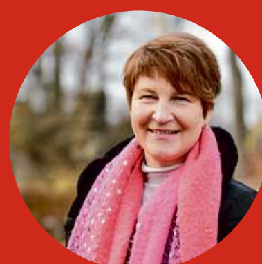
PLATZ 18 GRIT BLAZER