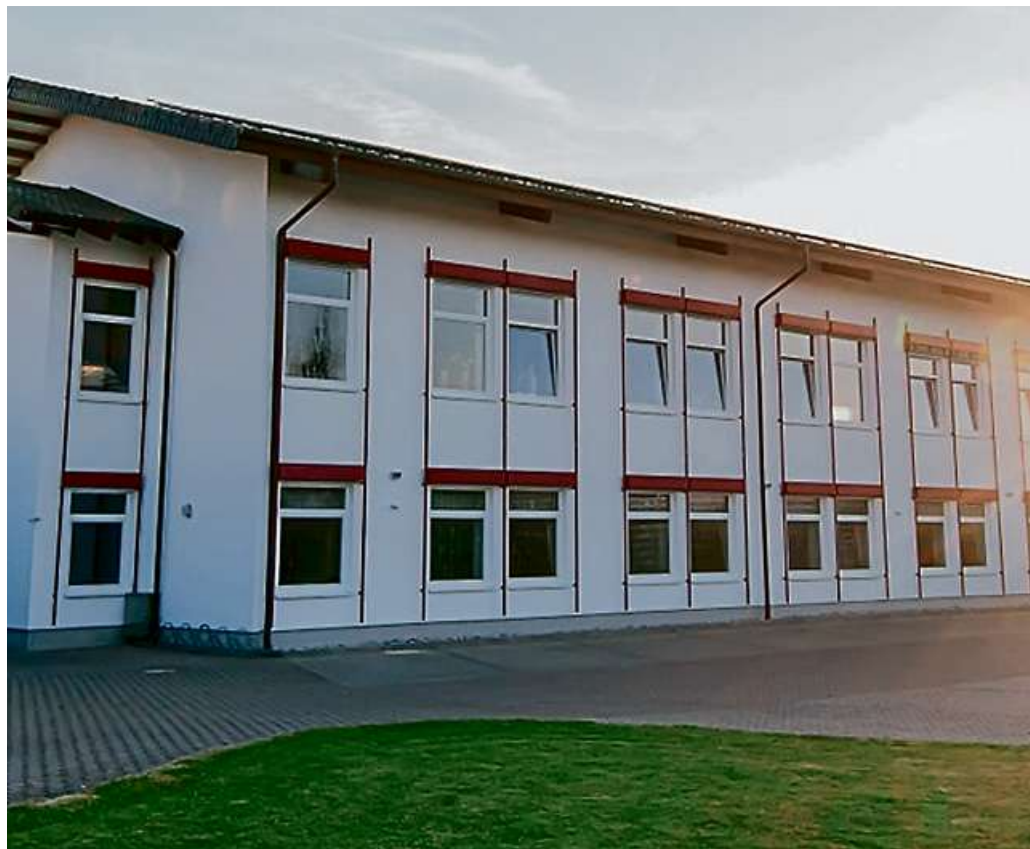
Gemeindehaus der Christlichen Versammlung Manderbach.

Christliche Gemeinschaft (Raiffeisenstr. 3): Sonntags: 10 Uhr Gottesdienst im Gemeindehaus. Gleichzeitig ist der Gottesdienst auch im Livestream zu sehen. Gerne kann der jeweils aktuelle Link über info@cg-frohnhausen.de oder 02771/32691 erfragt werden.