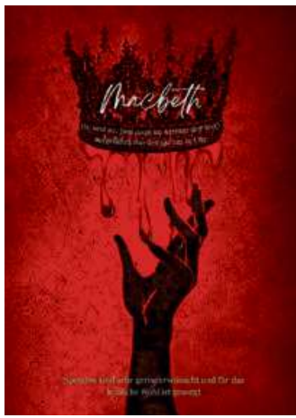
Kurse des Jahrgang 12 bringen „Macbeth“ von Shakespeare auf die Bühne.

DILLENBURG – Düstere Welten voller Macht, Ehrgeiz und Verrat können am 1. und 2. sowie am 8. Juni ebenso erlebt werden wie Beautybattles, Macho-Gelaber und Klimachaos, wenn die Schülerinnen und Schüler des Faches „Darstellendes Spiel“ der Wilhelm-von-Oranien-Schule am Ende des Schuljahres traditionell ihr Können unter Beweis stellen.