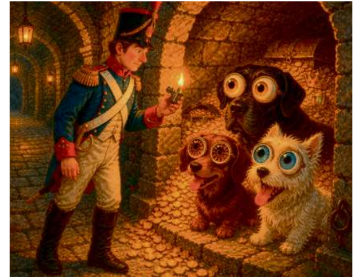
Zu einem besonderen Erlebnis für Kinder und Erwachsene wird die „Märchen-Führung“ in den alten Gewölben der Kasematten.

Die Führung beginnt am 14. Juni um 16 Uhr. Treffpunkt für alle angemeldeten Personen ist am Eingang des Wilhelmsturms. Die Dauer der Veranstaltung beträgt etwa 1,5 Stunden. Da es in den Kasematten kühl sein kann, wird den Teilnehmenden das Tragen von festem Schuhwerk sowie