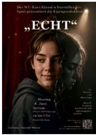
Schüler des Jahrgangs 9 präsentieren die Eigenproduktion „Echt“.

Den Abschluss des WvO-Theaterfestivals bildet am Montag, dem 8. Juni, um 19 Uhr im Atrium, die Eigenproduktion der Schülerinnen und Schüler des Jahrgangs 9 unter der Leitung von Harald Minde mit dem Titel