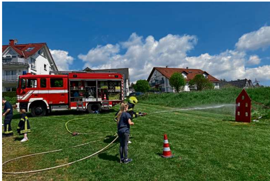
Die Feuerwehr aus Manderbach war mit ihrem Löschfahrzeug gekommen, das von den Besuchern genau inspiziert werden konnte.

Die Klasse 3a hatte die Feuerwehr Manderbach eingeladen, welche mit einem Löschfahr-