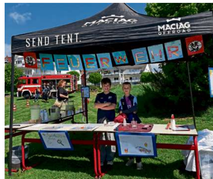
Am Stand der Klasse 3a wurden Experimente vorgeführt und die Schülerinnen und Schüler zeigten, wie ein Feuerlöscher funktioniert.

Die Klasse 4 setzte sich mit dem Thema „Wald“ auseinander: Mit Waldmeisterbrause versorgt, konnten die Kinder einen selbst gebauten Barfußpfad aus-