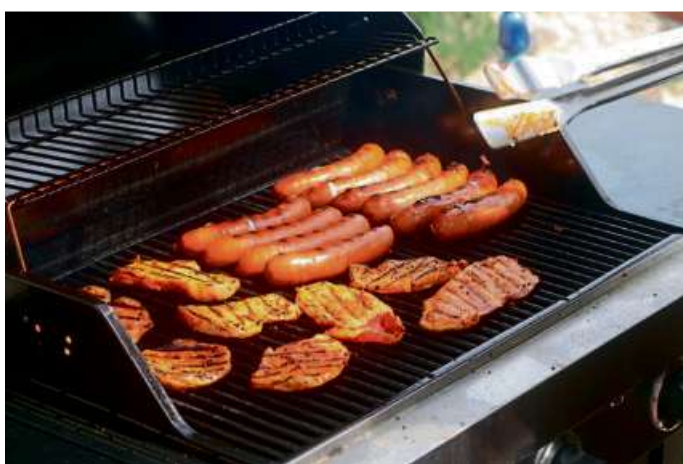
Vor dem Kauf eines Gasgrills sollte man unbedingt auf die CE-Kennzeichnung und Bedienungsanleitung achten.

REGION (red) – Es ist wieder Grillzeit. Dabei kommt nicht nur der klassische Holzkohlegrill zum Einsatz, sondern oft auch Geräte, die mit Gas betrieben werden.