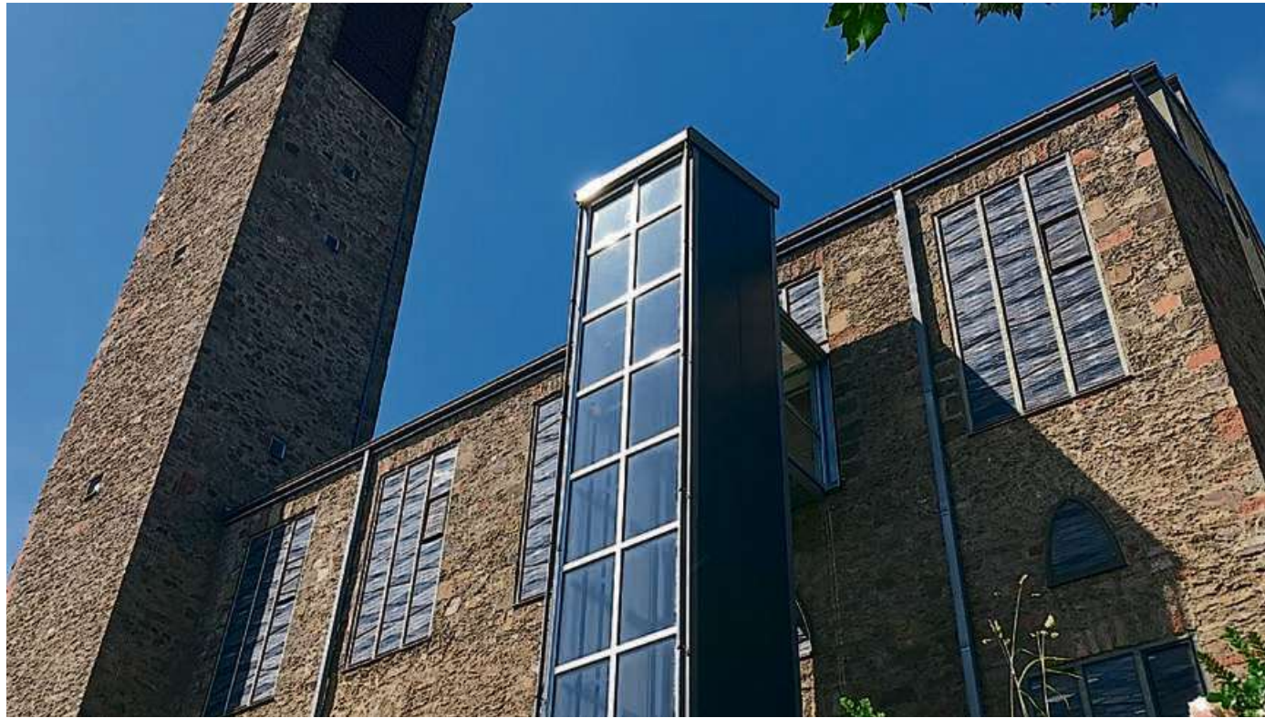
Die katholische Kirche in Dillenburg.