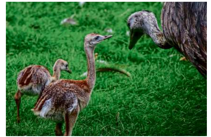
Im Tierpark in Donsbach können Besucher jetzt die kleinen Nanduküken bewundern.

DONSBACH (red) – Zuckersüßer Neuzuwachs erwartet die Besucher im Wildpark Donsbach. Die kleine Nandufamilie, bestehend aus einem Hahn und zwei Hennen, hat ihre ersten Küken ausgebrütet. Besser gesagt, der Hahn hat sie ausgebrütet. Die Damen haben nach der Eiablage nichts mehr mit ihren Nachkommen zu tun. Das Brüten sowie die Jungtierpflege übernimmt der Papa. Nach 35 bis 40 Tage Brutzeit, bleiben die Küken noch etwa sechs Wochen bei ihrem Vater, dann sind sie selbstständig.