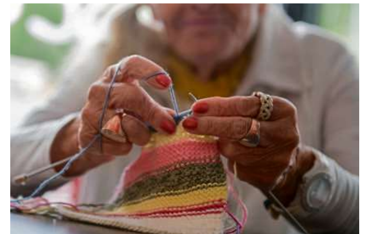
Die Erlöse des Strick-Workshops kommen vollständig dem Bau des Elisabeth-Hospizes zugute.

Hospiz ist für Herbst 2027 geplant. Die Einrichtung wird künftig 12 stationäre Plätze so-