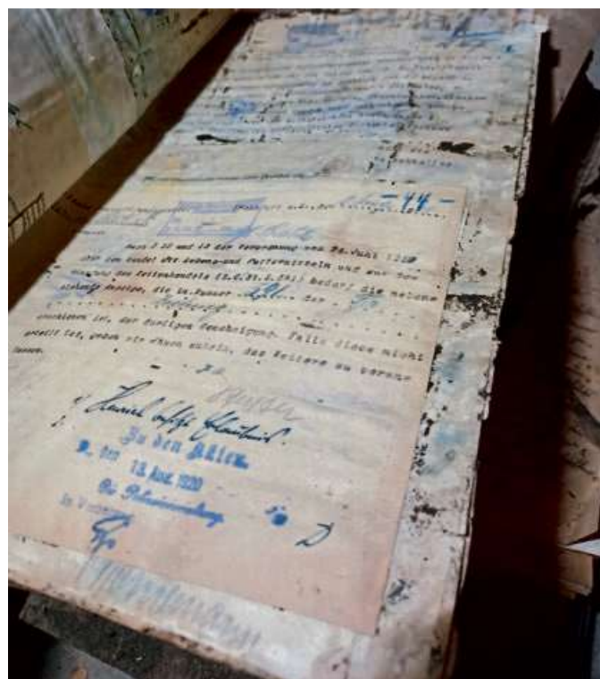
Durchnässung hat zu einem Schimmelpilz befall geführt. Die Akten können jetzt dank der Förderung eine Trockenreinigung erhalten und werden fachgerecht verpackt.

Schon auf den ersten Blick waren enorme Verschmutzungen und Schadensbilder zu erkennen. Offenbar war der Kellerraum in der Vergangenheit von einem Wasserschaden größeren Ausmaßes betroffen, vermutlich durch ein Hochwasser der nahen Dill oder ein Starkregenereignis. So zeigen insbesondere die unmittelbar unter dem Kellerfenster lagernden Akten starke Anzeichen von einstiger Durchnässung. Die dadurch induzierte Feuchtigkeit führte zu einem Schimmelpilzbefall, der auf einer Vielzahl von Akten – in einigen Fällen auch auf den Innenseiten – festzustellen ist.