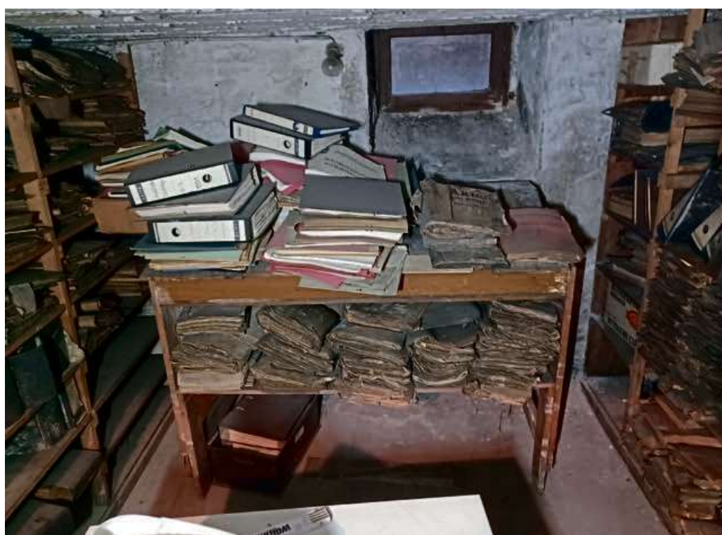
Ein verloren geglaubter Teilbestand von städtischem Schriftgut aus der Zeit von 1920-1949 lagert in einem Kellerraum des Dillenburger Rathauses und zeigt starke Schadensbilder.

Dillenburger (red) – Bereits zum siebten Mal in den letzten Jahren hat das Dillenburger Stadtarchiv Fördermittel für wichtige bestands-erhalterische Maßnahmen generieren können. Für 2026 ist eine Zuwendung in Höhe von 22.034 Euro vorgesehen. Dabei sind von der Koordinierungsstelle für die Erhaltung des schriftlichen Kulturguts in Berlin (Beauftragte der Bundesregierung für Kultur und Medien) Gelder in Höhe von 12.241 Euro und vom Land Hessen Mittel in Höhe von 9.793 Euro in Aussicht gestellt. Das Stadtarchiv Dillenburg kann damit die wichtige dekontaminierende Reinigung und Verpackung von schimmelpilzbefallenen Akten der Stadt veranlassen.